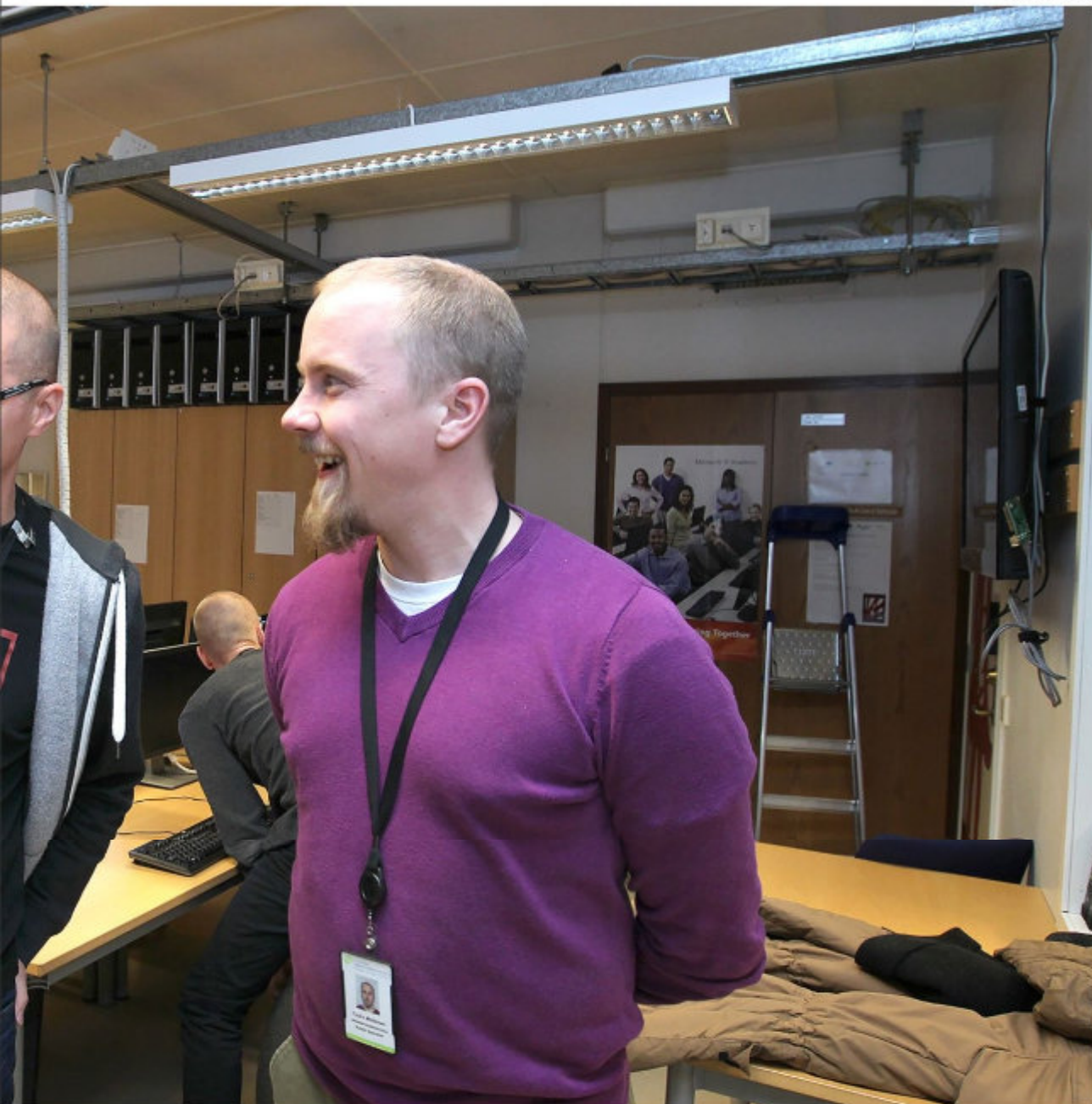
odottavat innoissaan supertietokoneen tuloa ammattikorkeakouluun.