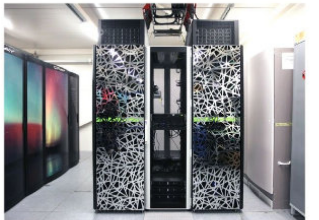
BULLIN supertietokone tulee ammattikorkeakoululle Renforsin Rannasta. Suomen valtion ja korkeakoulujen omistama CSC eli Tieteen tietotekniikan keskus on äskettäin poistanut Bullin käytöstä.